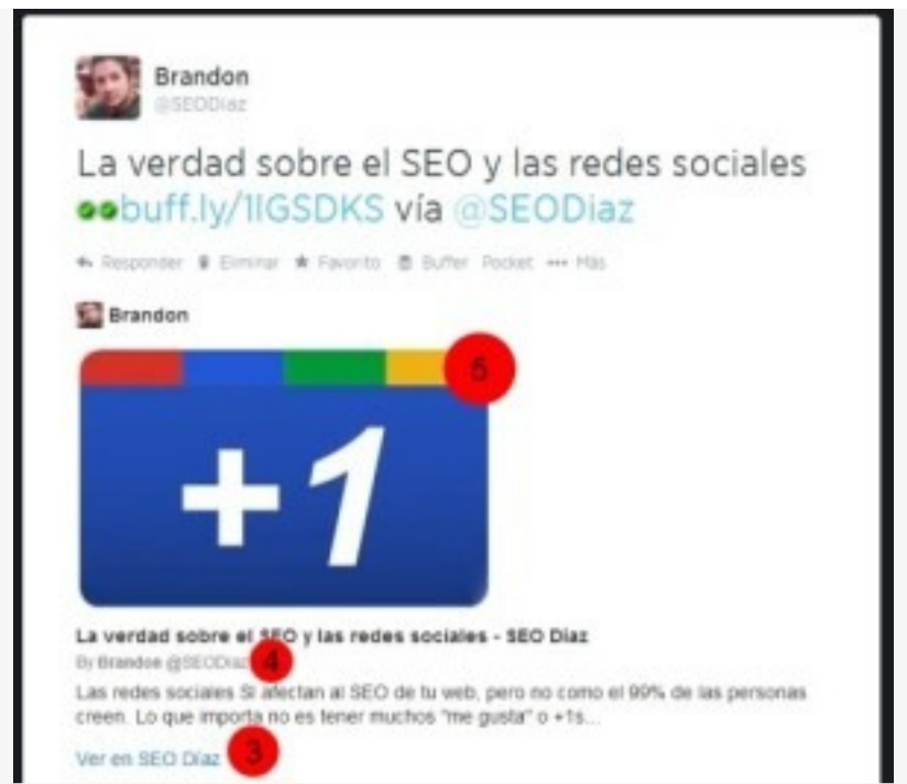
Aquí un ejemplo usando summary_large_image

Hay que tener algo importante en cuenta, hay algunos elementos que si Twitter no los encuentra tomará por default los indicados en OpenGraph . En mi caso no estoy usando ni twitter:description ni twitter:title, por lo que Twitter está tomando los valores que definí en og:description y og:title.